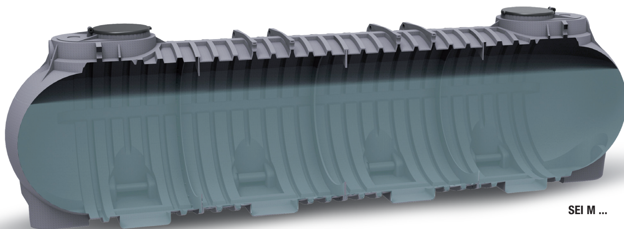
SEI M ...

SERBATOIO DI RISERVA IDRICA IN POLIETILENE DA INTERRO. POLYETHYLENE UNDERGROUND WATER STORAGE TANK.