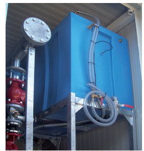
Serbatoio adescamento (in caso di installazione soprabattente) Storage tank in case of abovehead installation