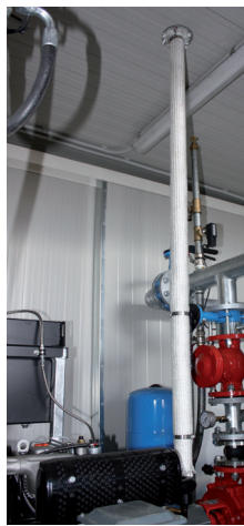
Condotto espulsione fumi Smokes outlet channel