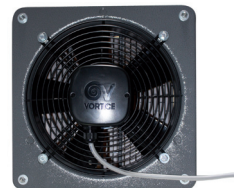
Ventola di espulsione aria Fan air expulsion