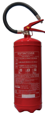
Estintore Fire extinguisher