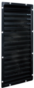
Griglia d' immissione aria Inlet air grid