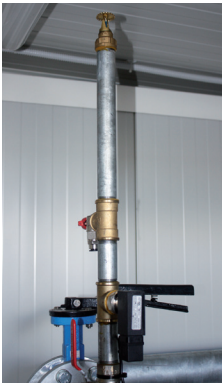
Kit splinker per protezione locale tecnico Sprinkler for protection of the technical roof