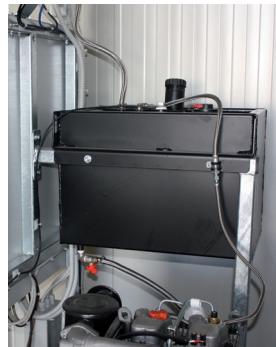
Serbatoio gasolio Fuel tank